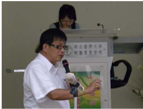
2010 年於台灣大學獸醫學院第 49 次比較病理研討會許教授認真講解的身影(49 CSVP 網頁)