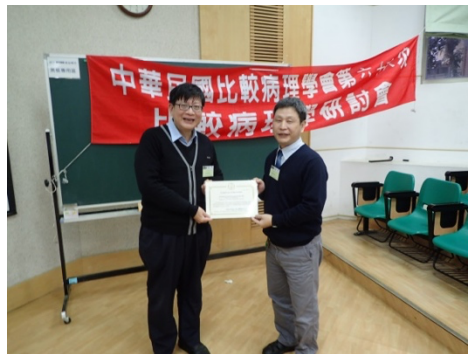
2016 年於中興大學獸醫學院第 66 次比較病理研討會與許教授開心合影(66 CSVP 網頁)